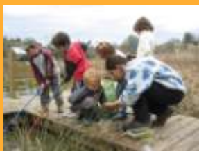
Animation au Marais de Bonnefont

ALVIGNAC - LAVERGNE - MAYRINHAC-LENTOUR - MIERS - PADIRAC - RIGNAC - THÉGRA