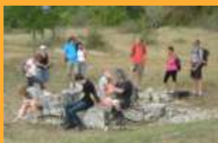
Balade découverte pendant l'été