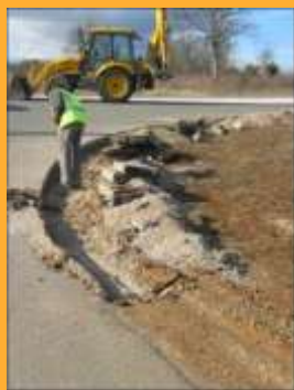
Aménagement à la Zone d'Activités de Rignac