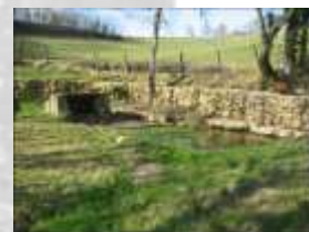
La fontaine de Labrunie Lavergne