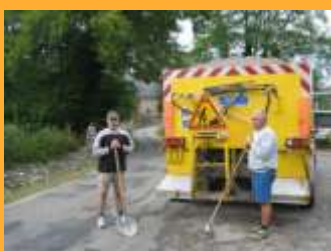
Les agents et le camion polybenne équipé du point à temps

Dans le cadre des compétences de la Communauté, les agents de l'équipe technique ont réalisé :