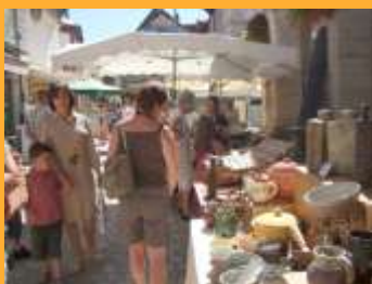
Marché des gourmands l'Hospitalet - Rocamadour