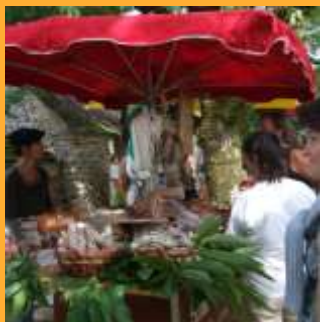
Marché des potiers (Gramat)