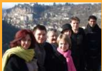
L'équipe de la Maison de Tourisme