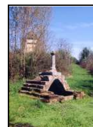
Fontaine de Bonnefont

Dénivelé : 18 m Balisage : jaune dans les deux sens Longueur : 6,5 km Durée : 1 heure 30 Accessibilité : à pied, à VTT Difficulté : facile Départ : parking marais de Bonnefont IGN 1/25 000 ème - n°2137 est, 2136 est, 2236 ouest, 2237 ouest