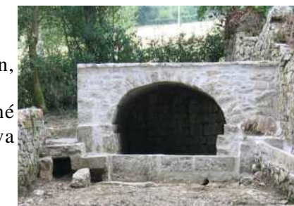
Fontaine du Bourg à Padirac

Le site Internet http://www.paysdepadirac.fr a trouvé sa vitesse de croisière. N'hésitez pas à nous contacter pour y faire figurer vos manifestations, ou toute information que vous souhaitez diffuser.