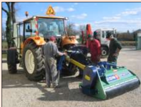
Le tracteur avec le broyeur d'accotement

Le tout pour un montant de 72 336 € HT et 12 800 € de reprises. Ces achats ont pu être réalisés grâce à un emprunt de 62 000 €, se substituant au précédent échu en 2009.