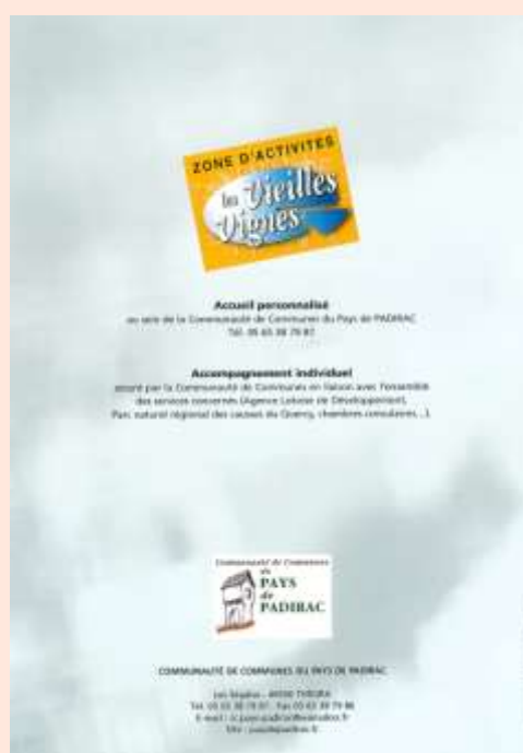
Plaquette de présentation de la Zone d'Activités les Vieilles Vignes - 46500 RIGNAC