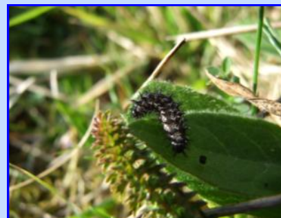
Chenille Damier de la Succise